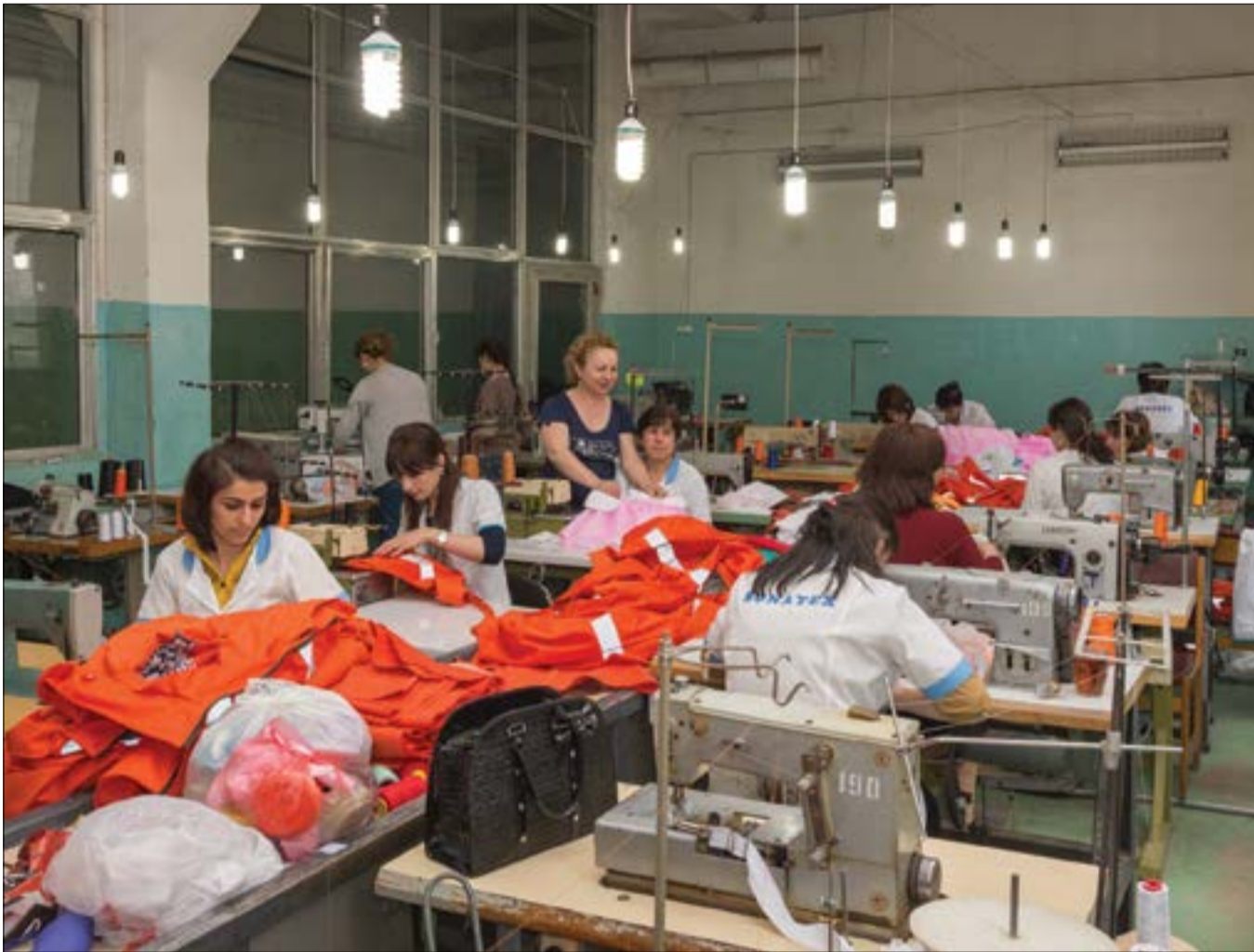
Կապանի տրիկոտաժի ֆաբրիկայի կարի արտադրամասը